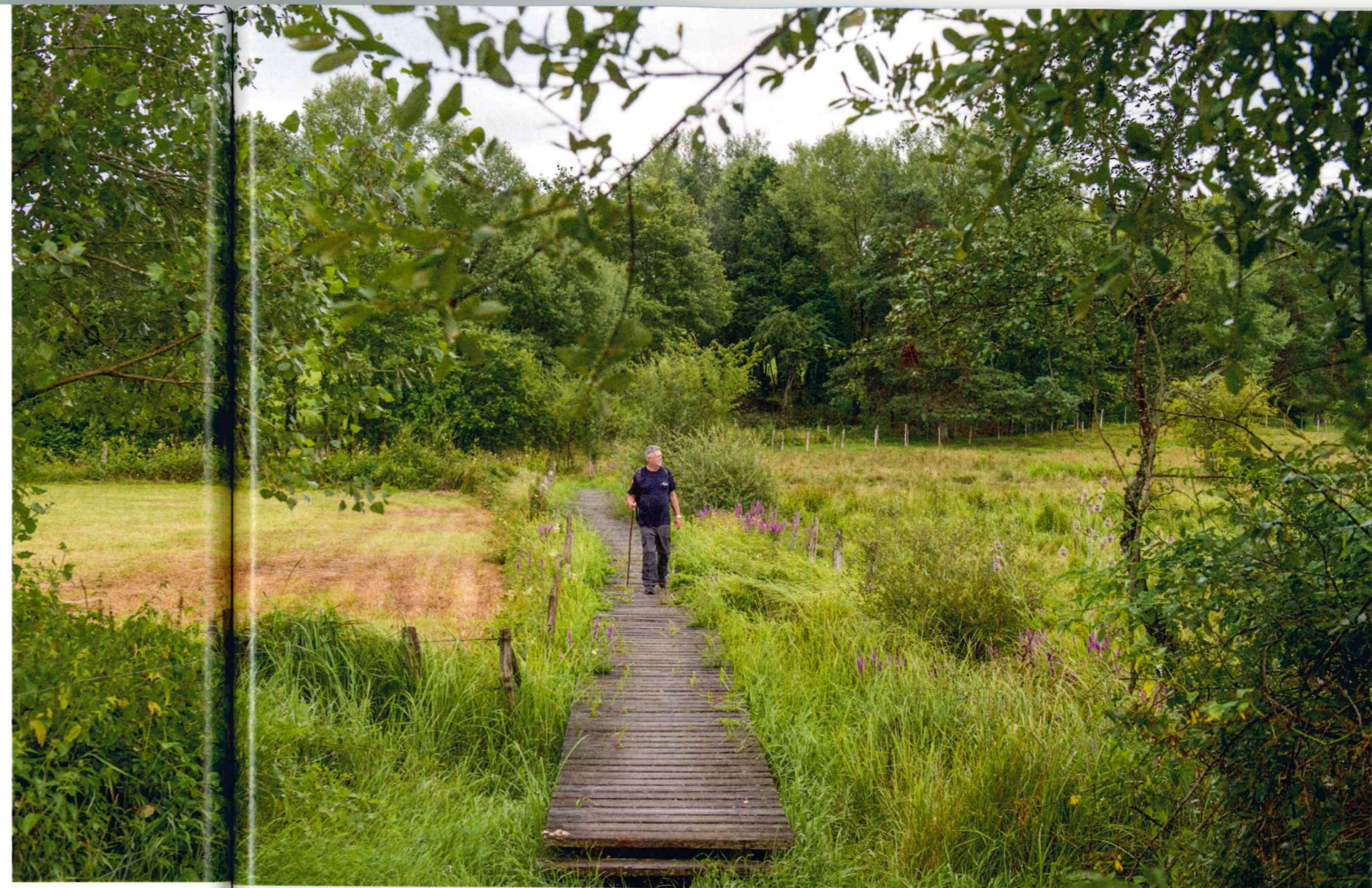
Ci-dessus , le sentier en caillebotis à travers le Camp de Lagarrigue, peu avant Lacamp.

À gauche , le caloptéryx vierge ( Calopteryx virgo ). La couleur bleu-violet des ailes du mâle se distingue des ailes brunâtres de la femelle.